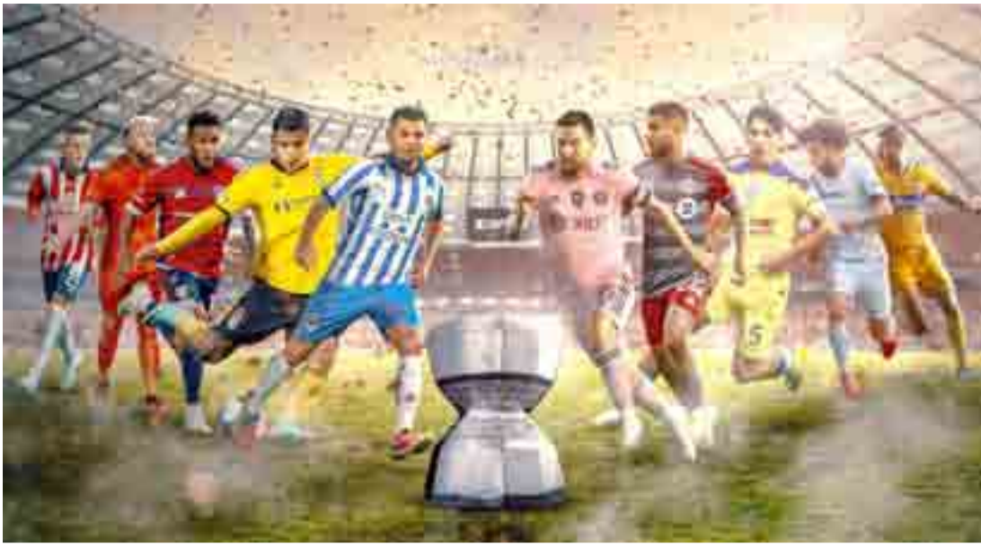
LEAGUES CUP 2024