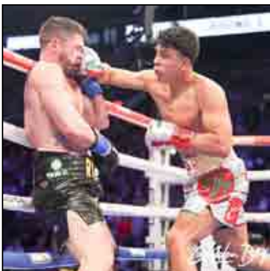
Jaime Munguía hizo lo que no pudo el "Canelo" Álvarez con el inglés John Ryder... ¡noquearlo!

La noche en Phoenix, Arizona inició bien para Munguía, quien en apenas el segundo asalto llevó a la lona a Ryder con una combinación de poder que encontró la mandíbula del que fuera rival de Canelo en mayo de 2023.