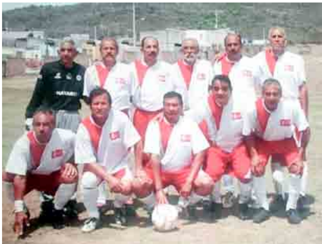
En la foto cuando fue campeón con Nayarit "B", torneo nacional "Platino".