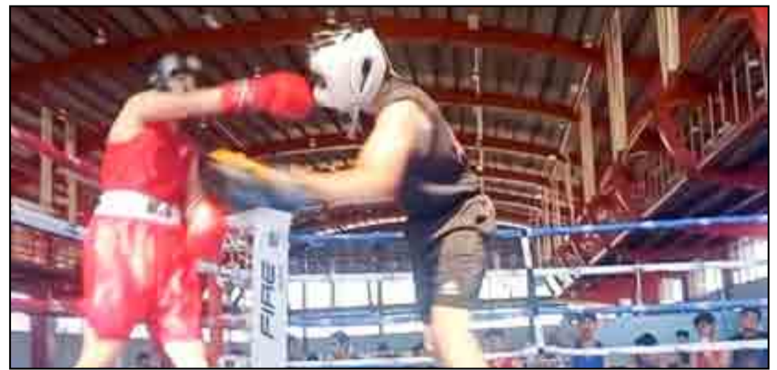
Así inician los que tienen sangre de guerreros. Joven pugilista