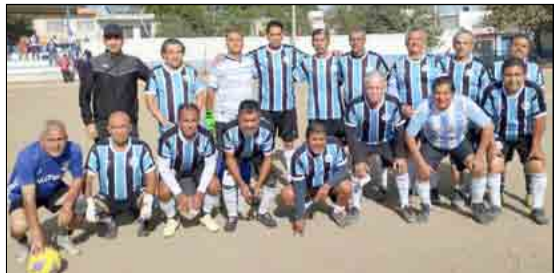
Nótese en esta foto tomada el domingo anterior, no aparecen los delanteros titulares.

todo fue limpio, dentro de las normas que exigen este tipo de eventos, y también es una muestra de que en Nayarit se está trabajando en el futuro del boxeo. Al recoger a opinión de López Ocegueda dijo sentirse satisfecho de haber combatido, es el principio de una carrera que, dice, dejará en el momento que él considere oportuno. Por el momento, dice: "Es una oportunidad para obtener esa disciplina que ocupamos los jóvenes", centrado el muchacho.