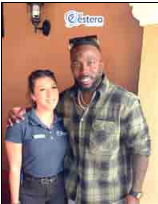
El pelotero de ligas mayores, Randy Arozarena comió en el Restaurant "El Estero", ubicado en el libramiento oriente de la capital nayarita, aquí lo vemos en la fotografía con una de las demás que atienden en ese excelente restaurant de mariscos