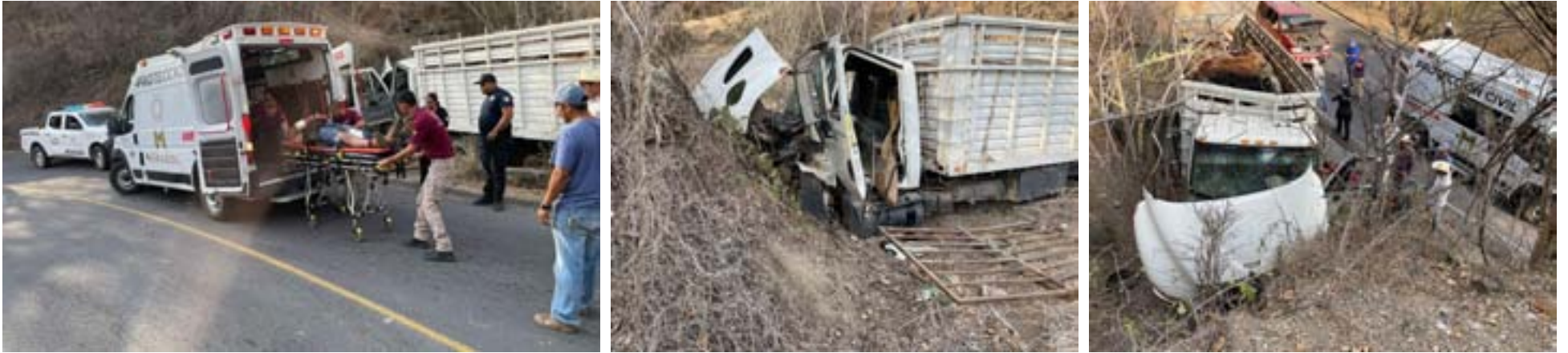
Se quedó sin frenos en carretera de Amatlán de Cañas