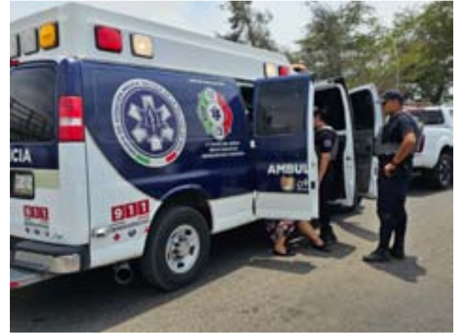
En el libramiento de Tepic