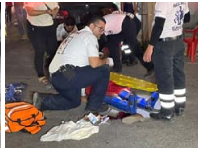
En la colonia Lázaro Cárdenas