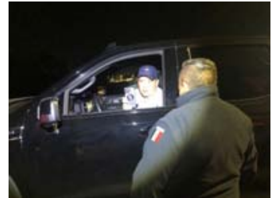
Amenazó a los elementos de la Policía Vial