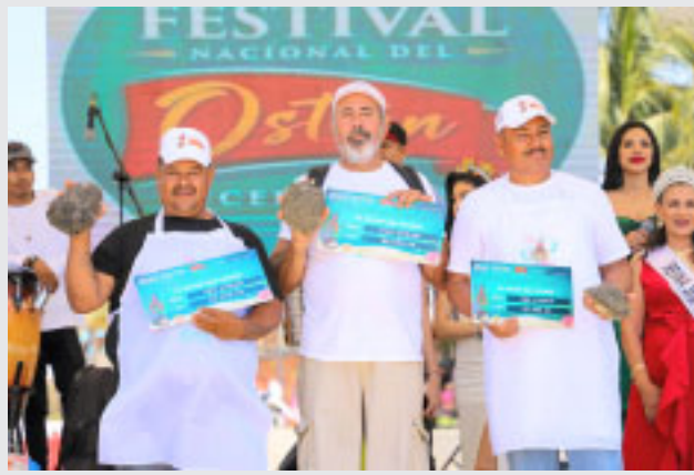
Se desarrolló en Bucerías 2024