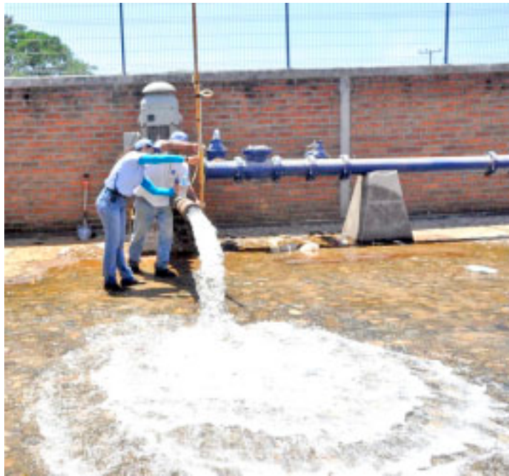
Durante Semana Santa, informa SEAPAL Vallarta