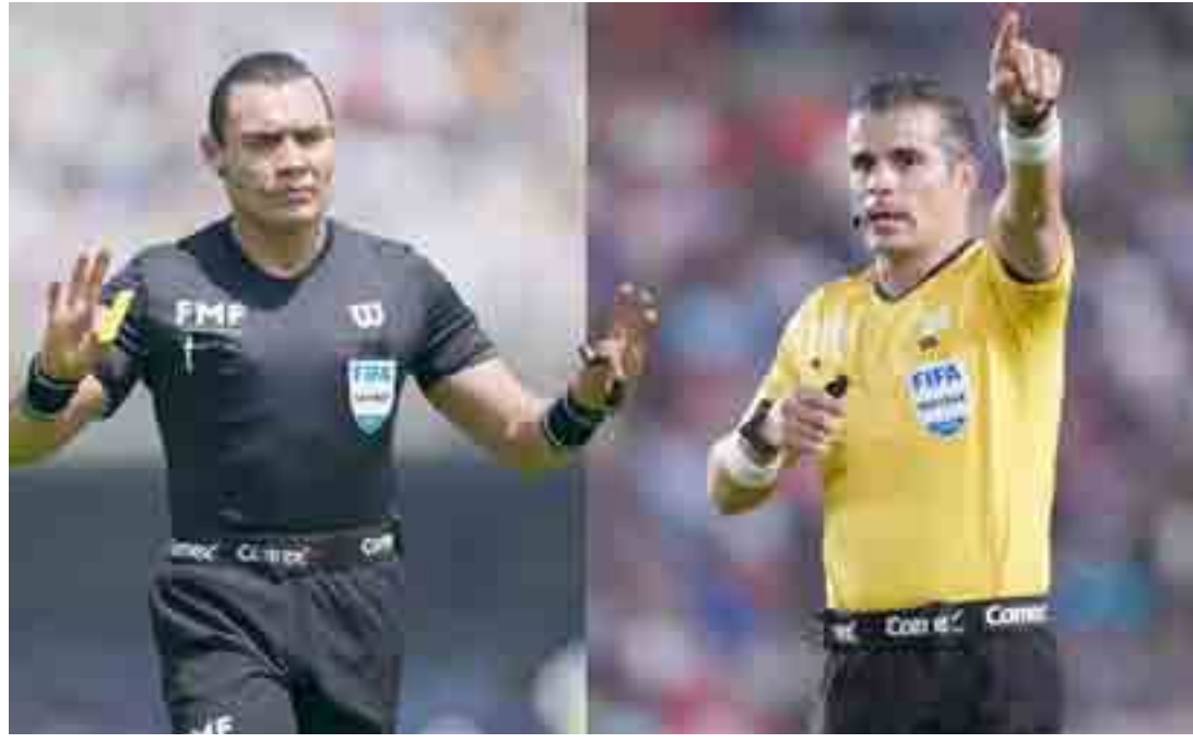
Comisión de Árbitros autónoma.