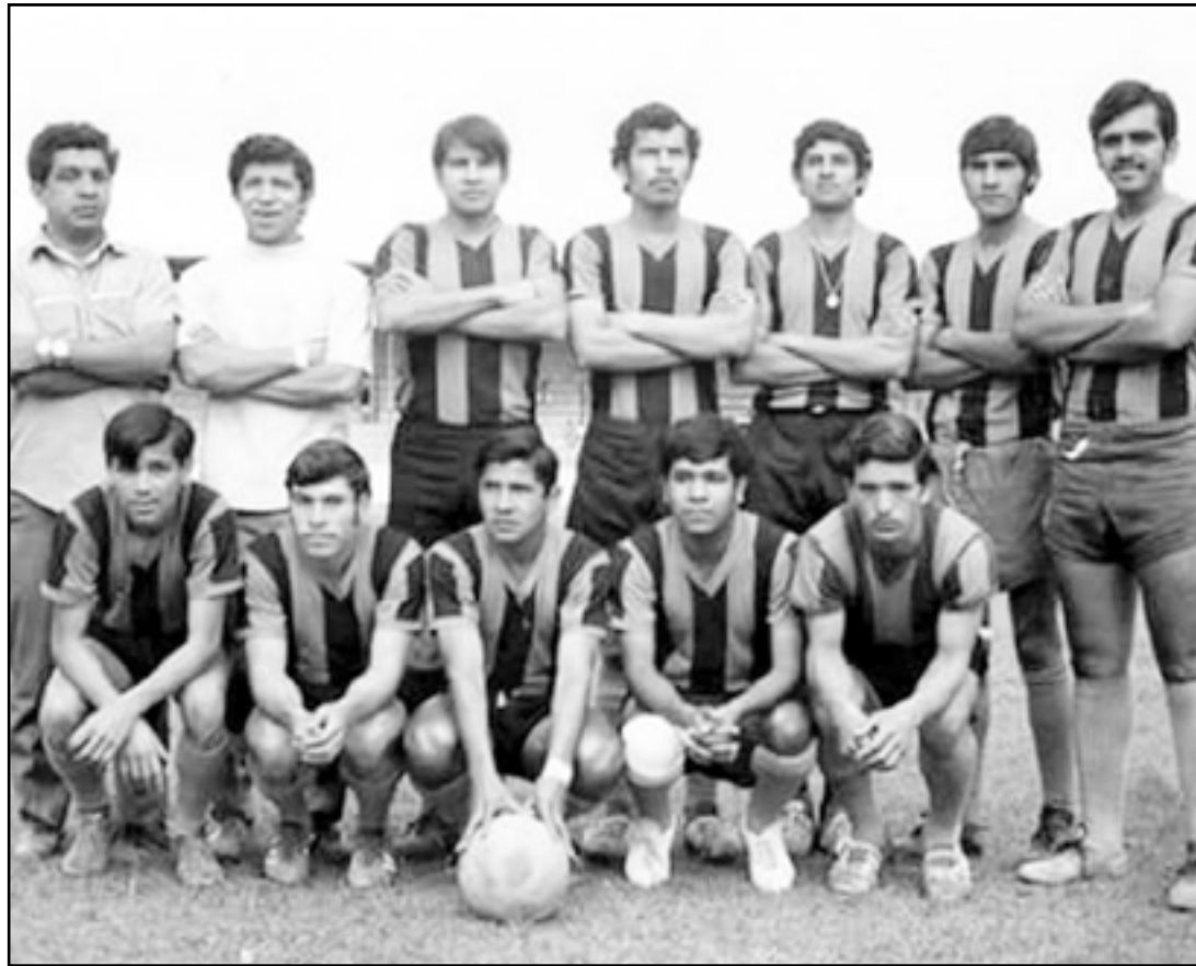
Tremendo ariete, de los goleadores de aquel casi invencible Batemeta

Pandra: "El hacer gol, era mi fuerte ser centro