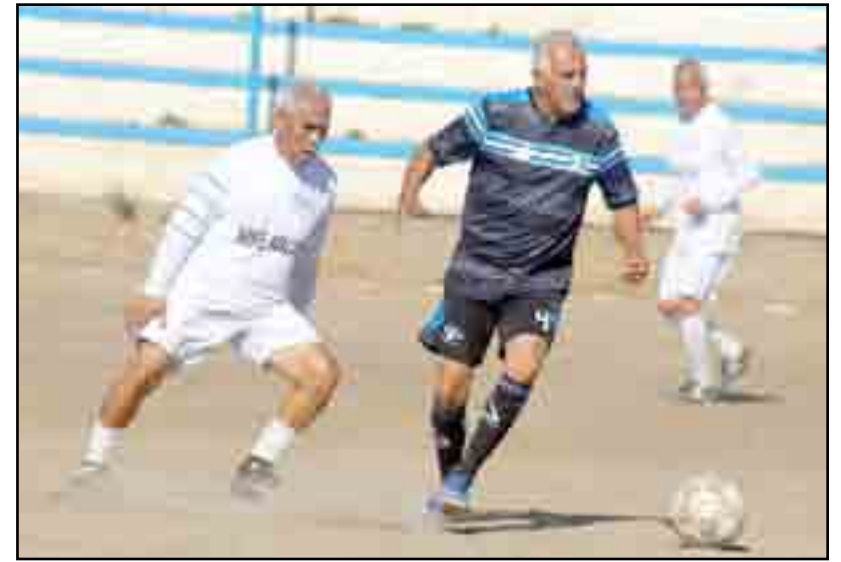
Goleadores de Provi, hicieron la gran diferencia.

Regresaron del descanso pero la película siguió siendo, a los cinco el desatado "Viejito" Gallegos aumentó su cuenta y metió otro, en el 12' Poncho se la puso a modo a Gallegos, este se enfiló, el can cerbero zapote salió a lo suyo, el tiro fue desviado