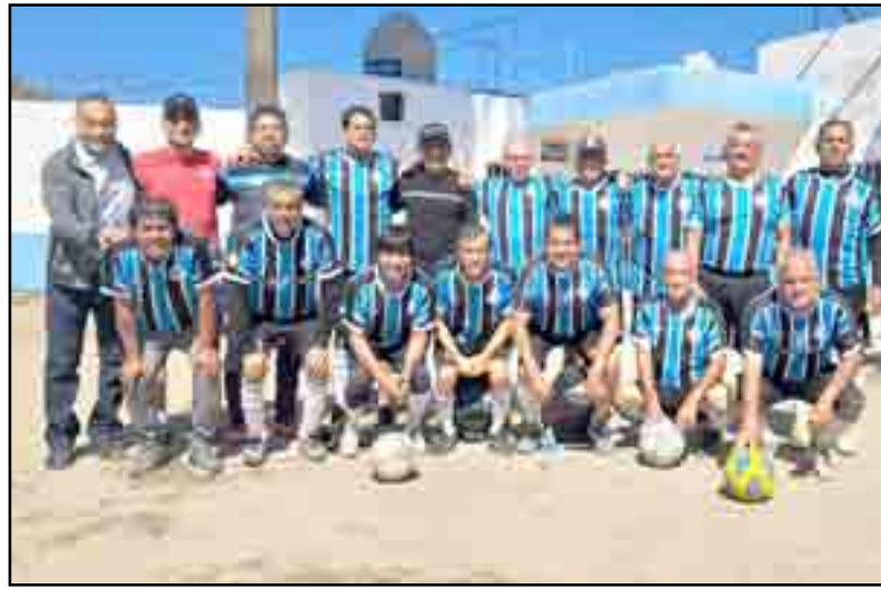
Goleó Real Provincia a Quinta Zapote, aunque increíble nos parezca.

Y llegó el maldito desconcierto al Zapote, 3-0 era mucho ya, con decirle que luego del toque de esfera después del gol nadie hizo por ella, cosa que Ponchillo, ni tardó ni osó Pérez, aprovechó el regalo y metió el cuarto ¡vaya pues!