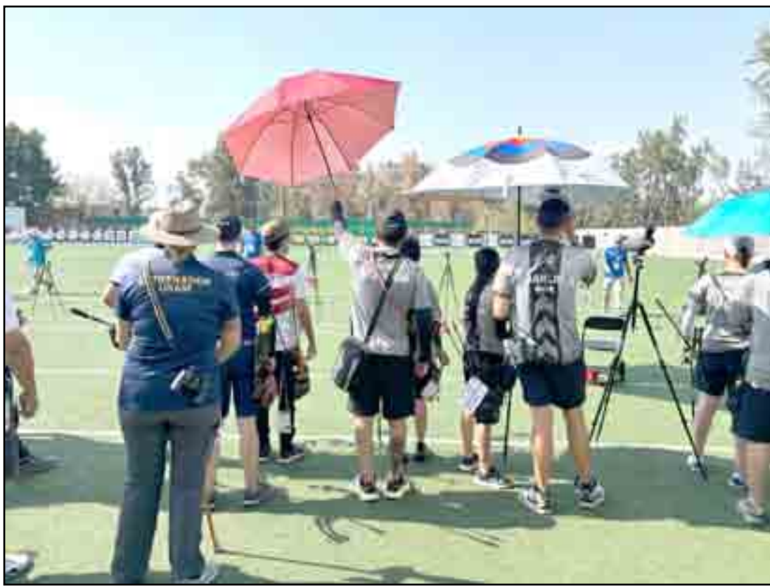
Con temple y enfocados

regaría, más o menos 20 minutos. En el otro partido definitivo, Emiliano Zapata AC le ganó a Lázaro Cárdenas en Lo de Lamedo 2-0, goles de Felipón y Parra, luego comentaremos sobre esta, un tanto rara clasificación del AC.