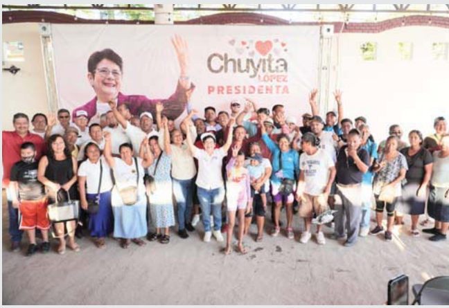
Trabajarán de la mano