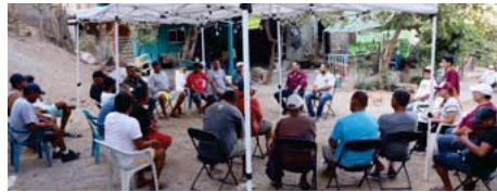
En Bahía de Banderas