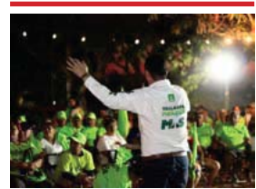
Vista Hermosa está con él