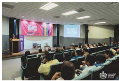
Festival Universitario Gran Nayar 2024

El titular de SIPINNA, agregó que los días 13 y 14 de junio, se impartirá el taller de capacitación Desde casa se Trata la Prevención , por parte de la Dirección de Prevención del Delito, en el que se abordarán los temas del Modelo psicoeducativo en torno a abuso sexual infantil y Desde casa nos cuidamos . Será en el salón de Cabildo de la presidencia municipal y será abierto a las personas que deseen asistir.