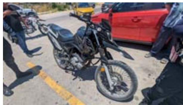
EN LA AVENIDA FRANCISCO VILLA...