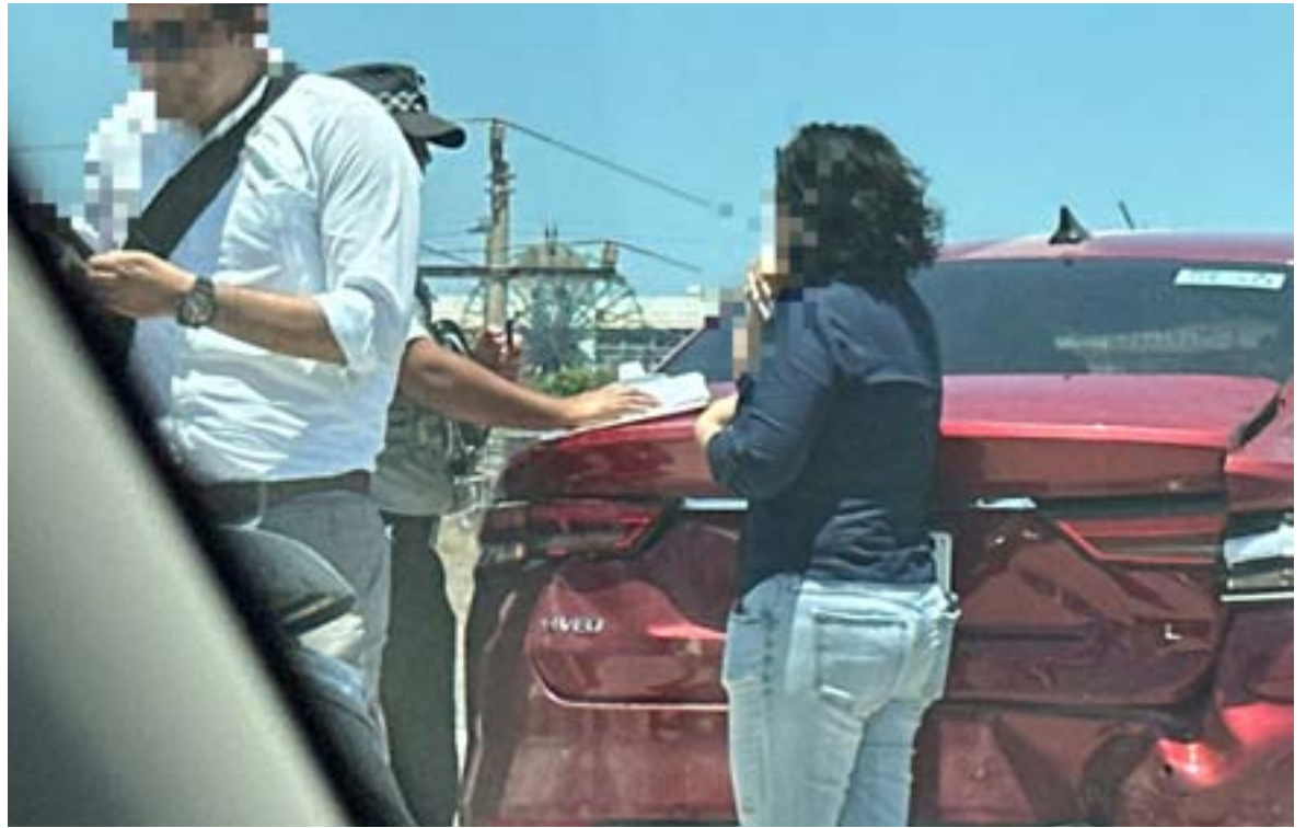
PROVOCARON GRAN CAOS VIAL...