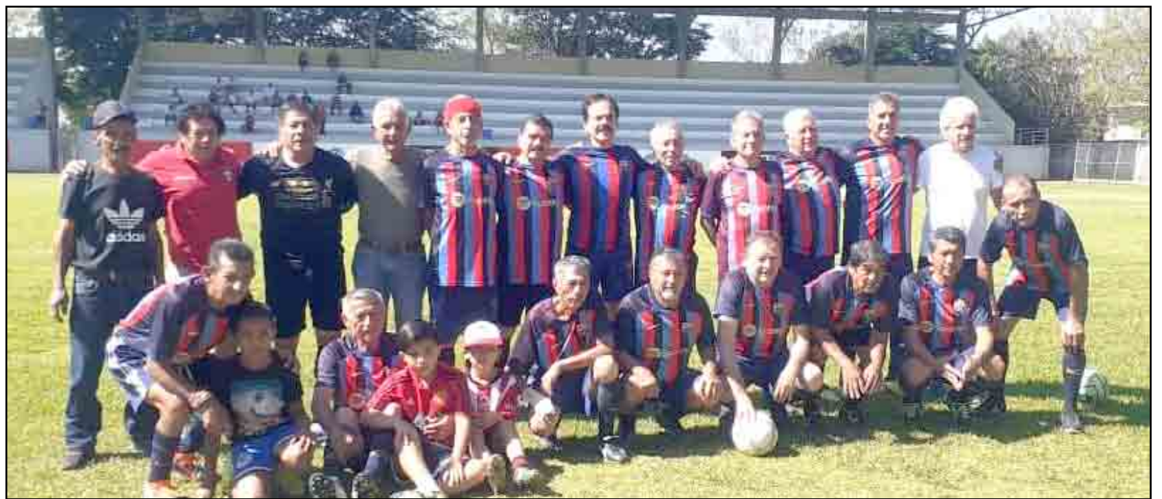
Rieleros con muchas posibilidades de ser campeón