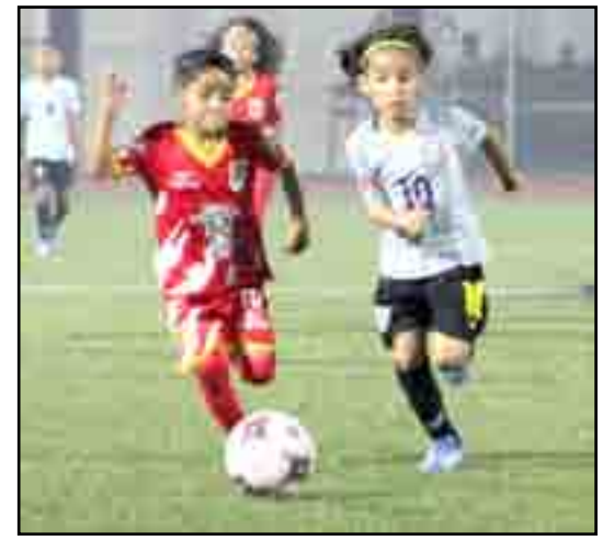
Al tú por tú contra Baja California.