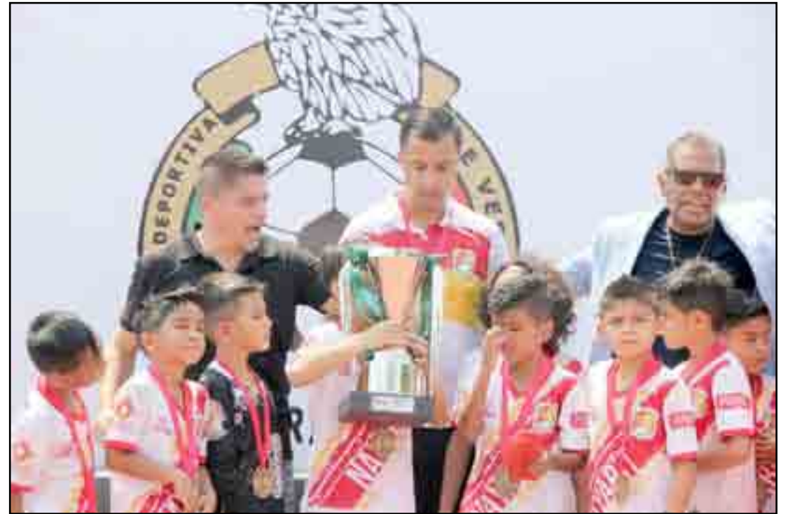
Gran satisfacción y significado para sus vidas deportivas.