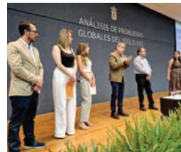
Diseñada con la colaboración de 60 expertos