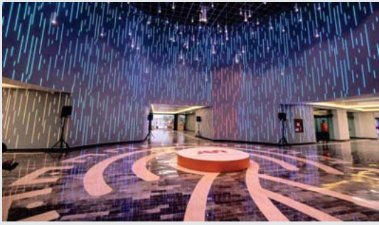
Gratuito del 18 al 30 de junio