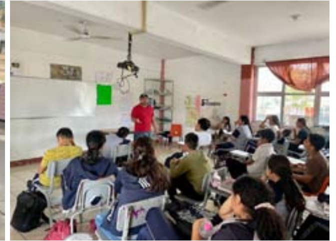
Entre estudiantes de Nayarit