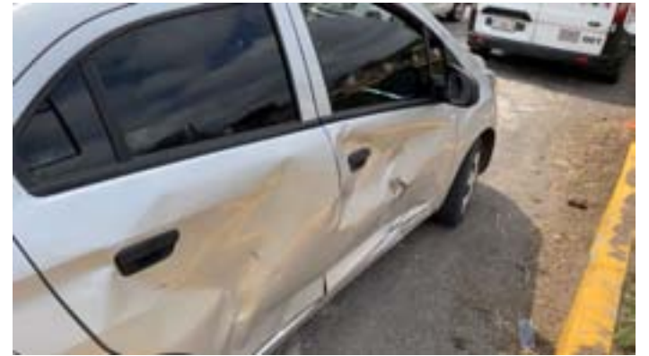
Al impactarse contra un vehículo