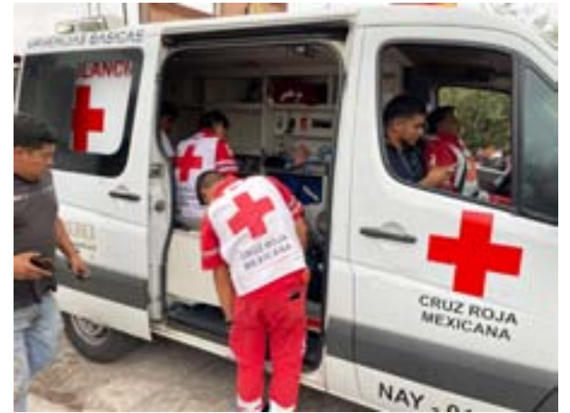
En la colonia Hermosa Provincia