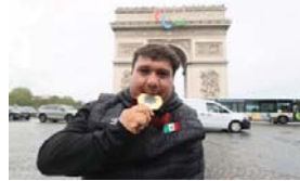
Más de 17 medallas en los Juegos Paralímpicos