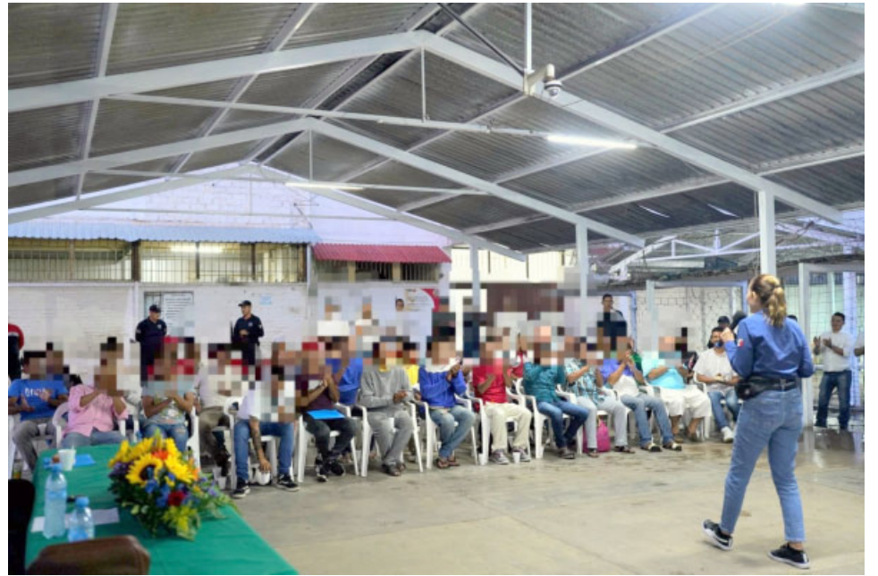
En el CERESO Venustiano Carranza