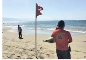
Puerto Vallarta-Bahía de Banderas