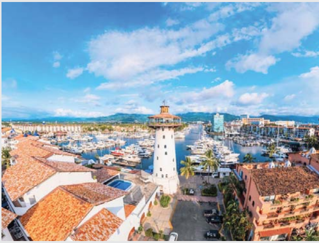
Ante el frío invernal