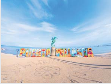
Puerto Vallarta-Bahía de Banderas