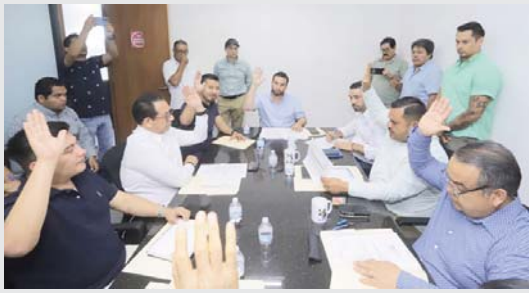
También luminarias del malecón