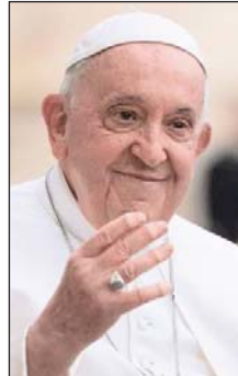
El Papa Francisco