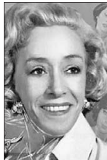
Yolanda Vargas Dulché