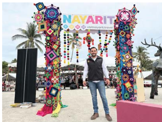
Impulsan la cultura en la Bahía

Los costos son 500 pesos en sombra general y 350 pesos en sol general y podrán ser adquiridos en las taquillas de la Monumental Plaza de Toros.