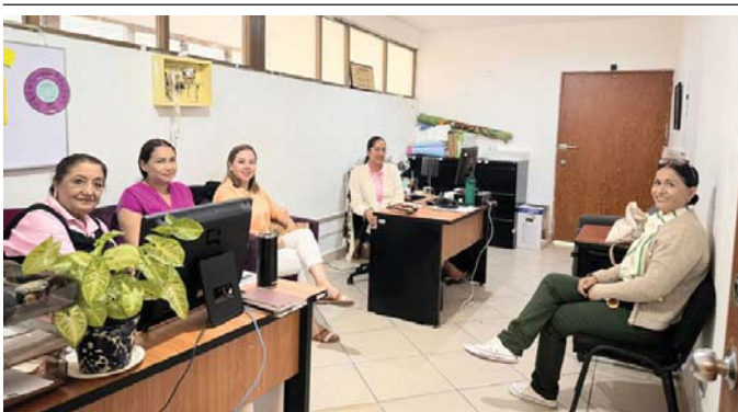
En el Instituto Municipal para la Mujer

Acerca de este fideicomiso, explicó que este estará conformado por representantes del gobierno municipal, tales como la Dirección de Turismo, representantes del Cabildo, así como del gobierno del estado y de los empresarios de la ciudad, las distintas cámaras y asociaciones.