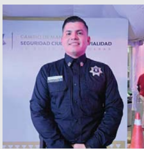
Anuncia primeros cambios