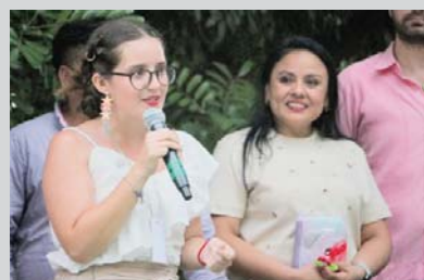
En el Parque Hidalgo