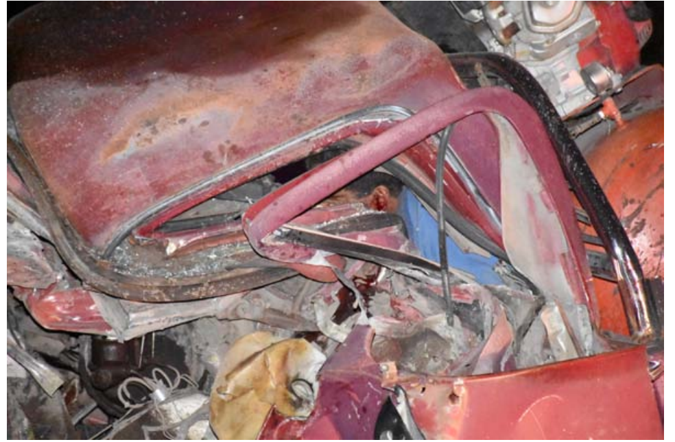
En la ciudad de Xalisco