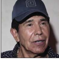
Rafael Caro Quintero