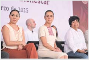
Llama al trabajo coordinado