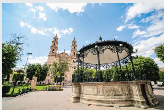
En encuentro comercial