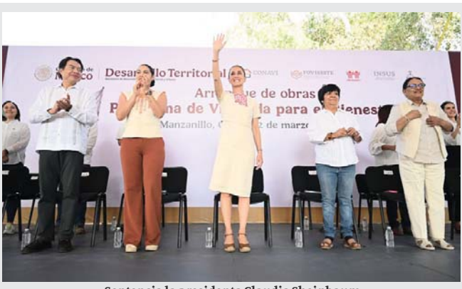
Sentencia la presidenta Claudia Sheinbaum