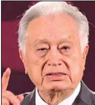
Manuel Bartlett Díaz