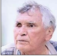
Miguel Ángel Félix Gallardo

Y todo ¿para que? Ni las gracias nos dieron por lo histórico del tamaño de la "ofrenda": 29 narcos entregados en charola de plata al gobierno estadounidense.