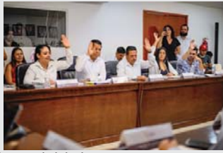
Aprueba cabildo diversas iniciativas