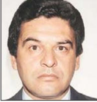
Enrique KIKI Camarena