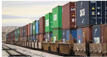
Presentó un broncoespasmo

Trump también agregó otro arancel del 10% a los productos chinos el martes, duplicando los aranceles del 10% que impuso el 4 de febrero. Trump ha culpado a China como la fuente del tráfico de fentanilo a los EU.