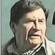
Ernesto Fonseca Carrillo