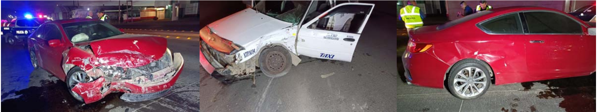
En el bulevar Aguamilpa