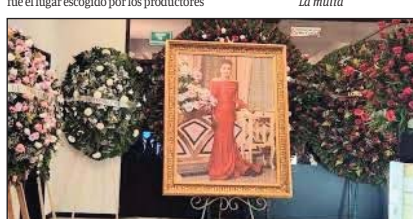
Los amigos de La Gilbertona