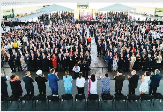
En presentación presidencial