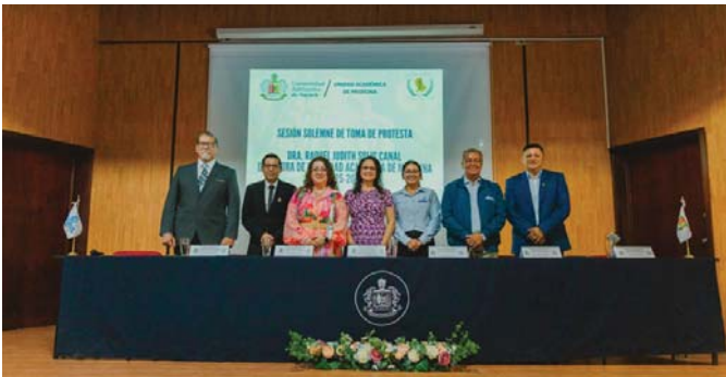
En la Universidad Autónoma de Nayarit

El gobernador Pablo Lemus reiteró su compromiso de trabajar de la mano con el Gobierno Federal para impulsar el crecimiento económico del estado y aprovechar las oportunidades que esta estrategia ofrece para el desarrollo de Jalisco.