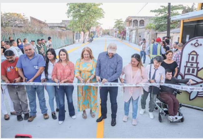
“Vamos a hacer justicia con hechos”, dice