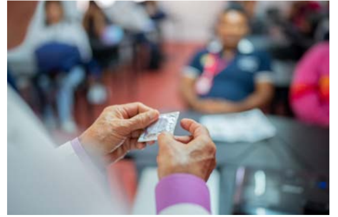
Para estudiantes del CAIPA