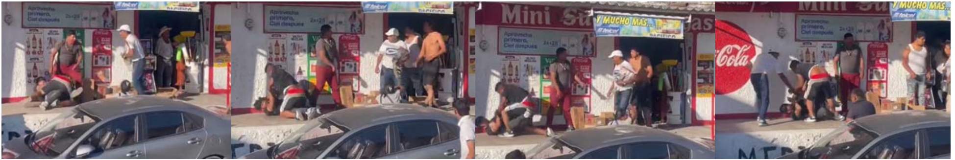
Se les metió el diablo