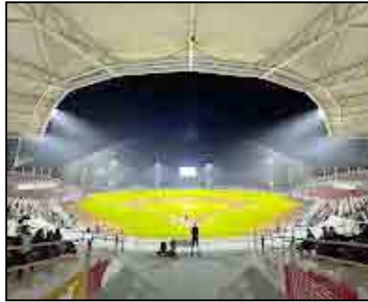
¡Imponente!, así luce el Coloso del Pacífico esperando oficialmente los juegos de la liga Arco Mexicana del Pacífico.