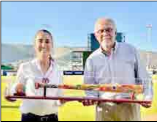
La presidenta de México, Claudia Sheinbaum Pardo y el gobernador de los nayaritas, Miguel Ángel Navarro Quintero inauguraron el Coloso del Pacífico