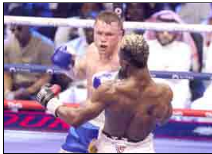
Canelo - Scull