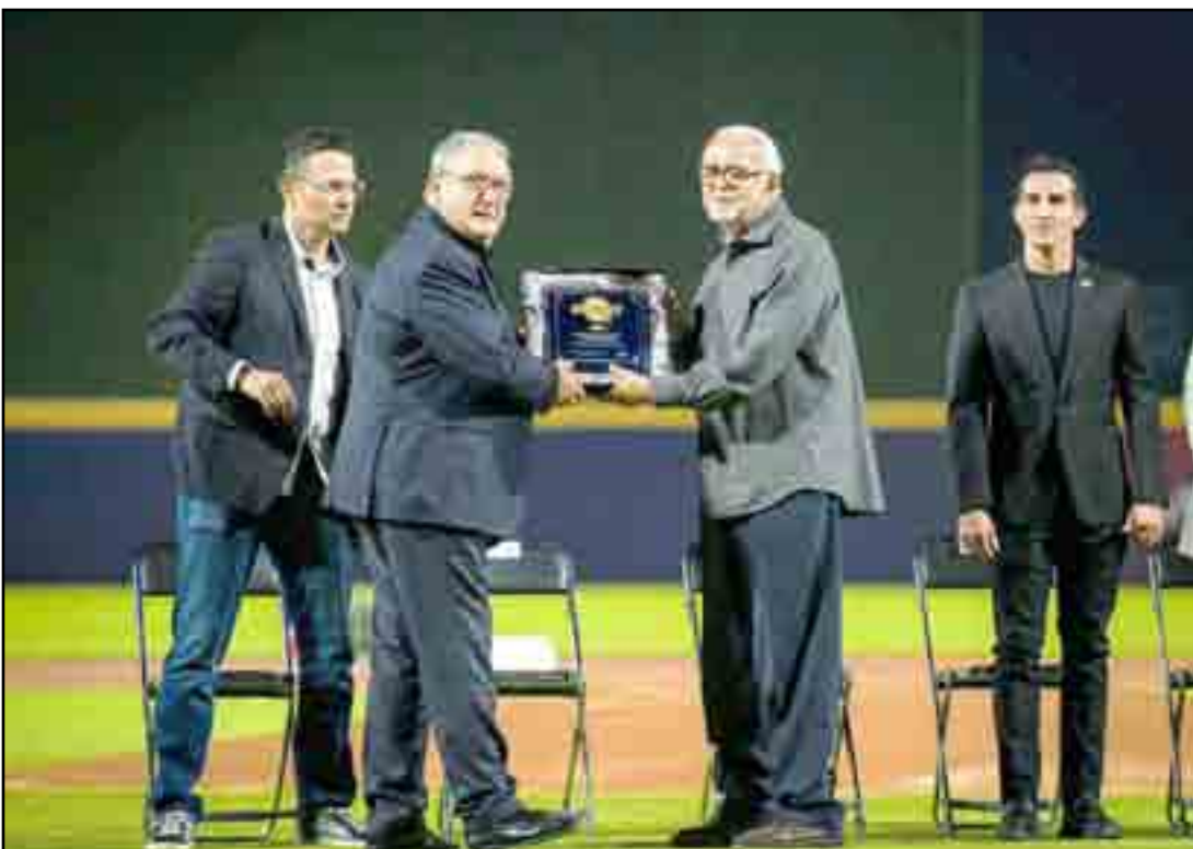
El gobernador nayarita, Doctor Miguel Ángel Navarro Quintero cristalizó los sueños de los aficionados a la pelota caliente de la entidad, aquí con personajes que fueron fundamentales para lograr que se cumpliera el proyecto.

Recordar que América perdió su más reciente final ante las regiomontanas, mientras que su corona más reciente, la obtuvo justamente cerrando de local, contra las hidalguenses.