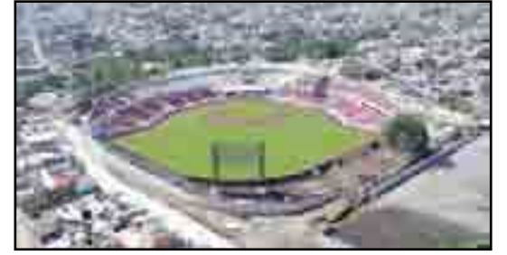
Vista aérea del Coloso del Pacífico.

y cualquier lugar es tema cotidiano, veremos qué pasará y aquí el régimen gubernamental jugará un papel importante para facilitar que los costeros vengan a la capital del tizne de Menchaca y del Istete, poniendo autobuses de ida y retorno a los aficionados pata salada a sus lugares de origen. Después de algún tiempo volví a la tecla, varios meses han pasado y este mes de mayo, no quise dejar atrás este tema que llena de regocijo a los beisboleros y beisbolistas, a los que saben y a los que les apasiona solamente, que disfrutaran el rey de los deportes desde el llano y ahora tendrán la oportunidad de ver con la casaca de "jaguares" de Nayarit a los grandes como "Tomateros" de Culiacán, "Venados" de Mazatlán y "Naranjeros" de Hermosillo y expresan que si les alcanza la cartera por lo difícil de los dineros, irán a ver jugar a Mexicali, Tijuana, Guasave o Mochis, bueno eso dicen, así que a la vuelta de la esquina, cuando menos pensemos estaremos en octubre cantándose ¡Playybooo!!!