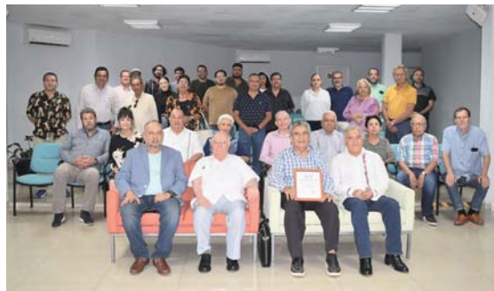
Celebra IMPLAN con seminario