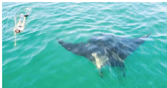
En el Pacífico Mexicano