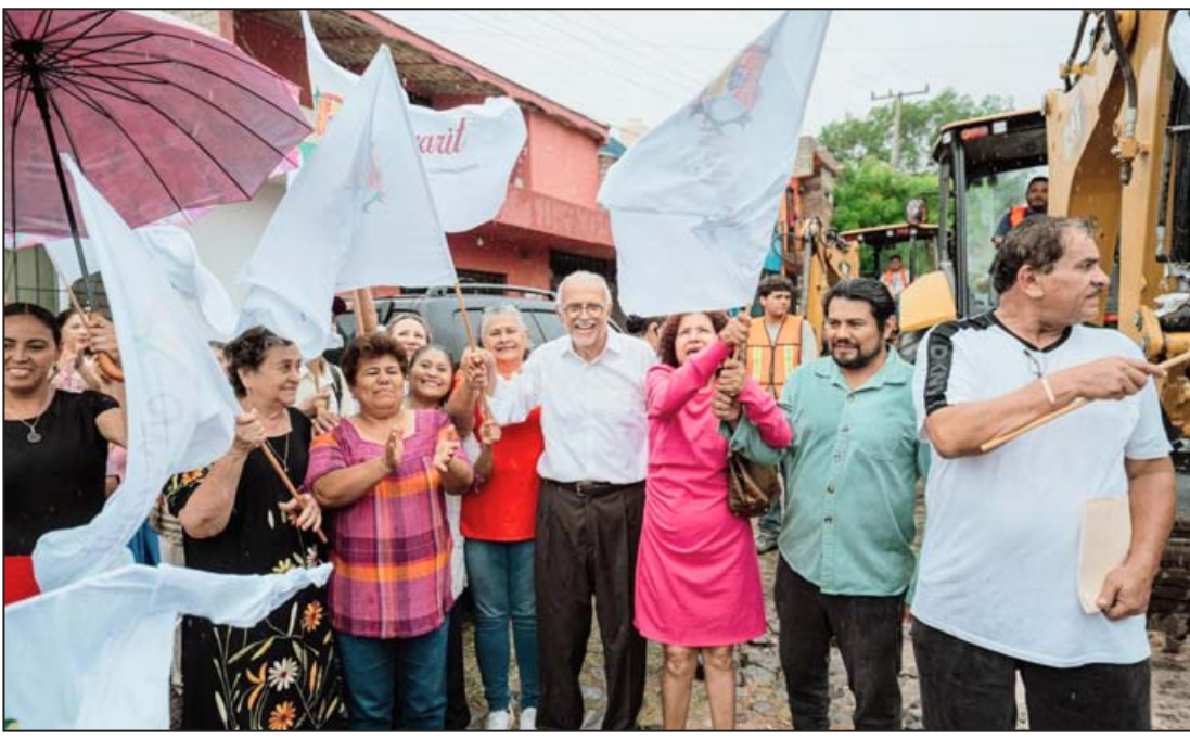
Impulsa el gobernador