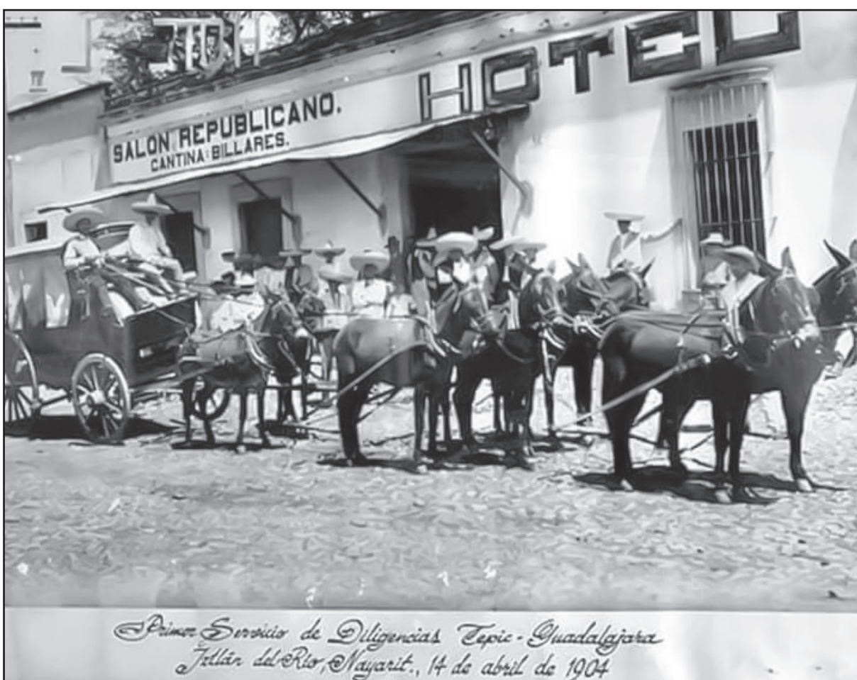
Primer Servicio de Diligencias Tepic - Guadalajara Jalisco del Río, Nayarit., 14 de abril de 1904