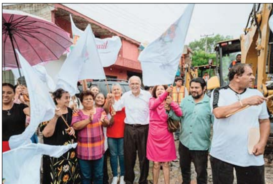
Da gobernador Navarro banderazo a obras

Ante esta situación, las autoridades del municipio de Tepic exhortaron a la población en general a manejar con precaución durante la temporada de lluvias, mantener la distancia adecuada y atender las indicaciones de tránsito para evitar posibles tragedias.