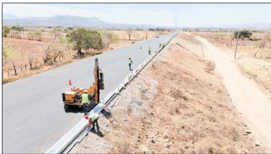
Avance de un 87 por ciento