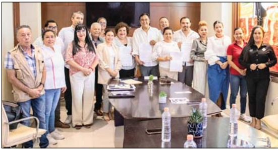
Amplía capacitación laboral en Jalisco