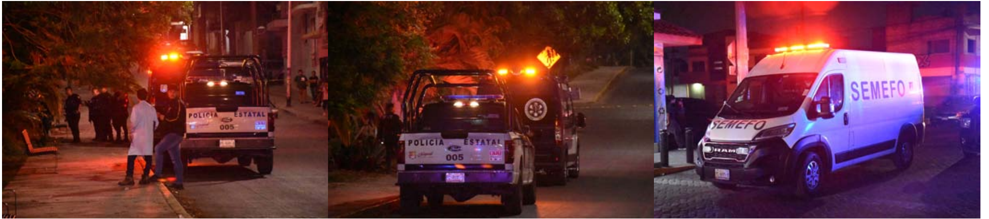
En Vistas de la Cantera