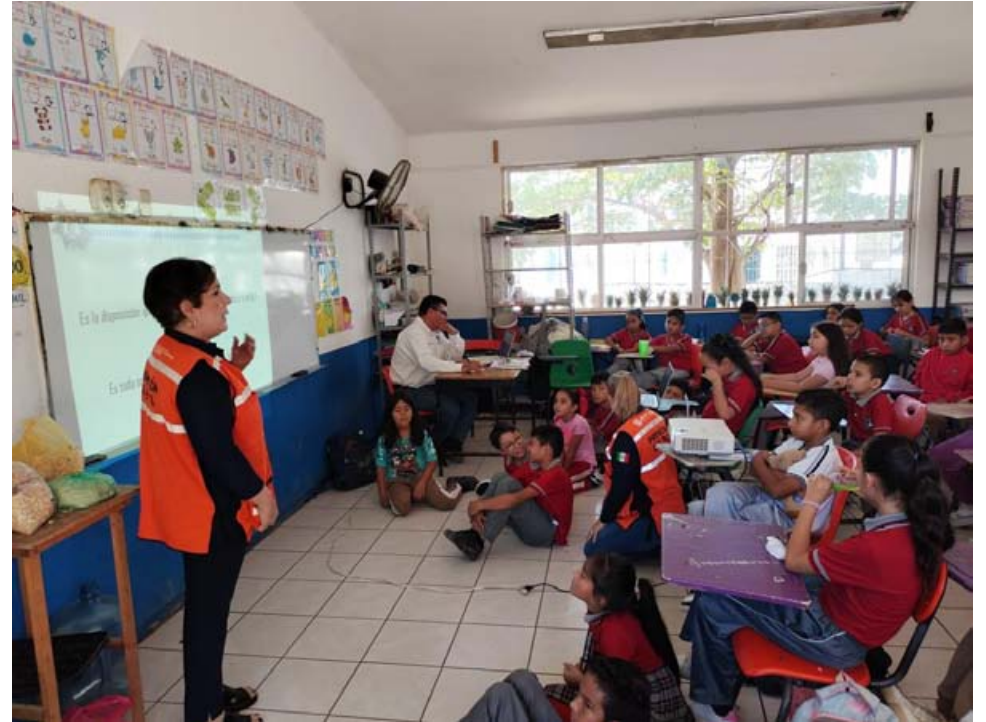
Dirigido a padres de familia y alumnos