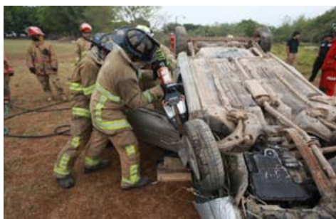
Bomberos de Tepic