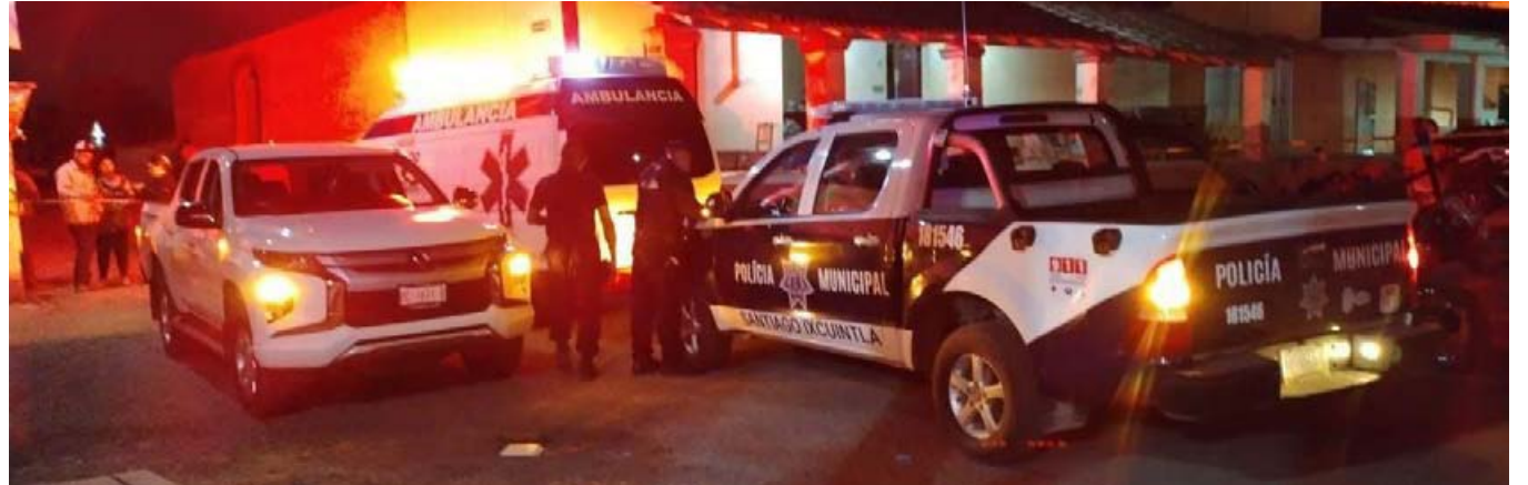
Borracho al volante