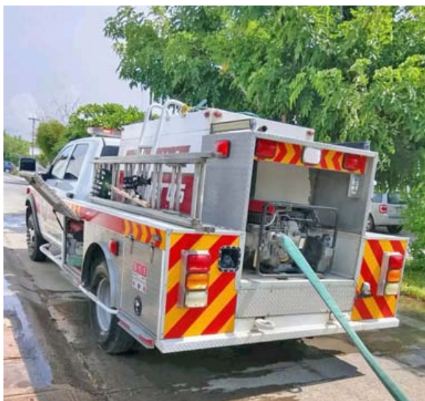
Por Adrián De los Santos MERIDIANO/Bahía de Banderas

*Las autoridades y los cuerpos de auxilio fueron alertados en el sitio *El lesionado fue llevado a recibir atención médica a un hospital y bomberos controlaron la situación