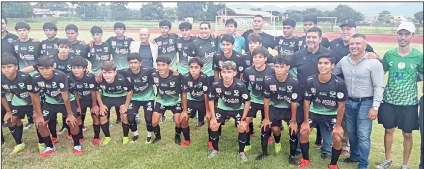
VADS... duro compromisso ante Atlético Nayarit