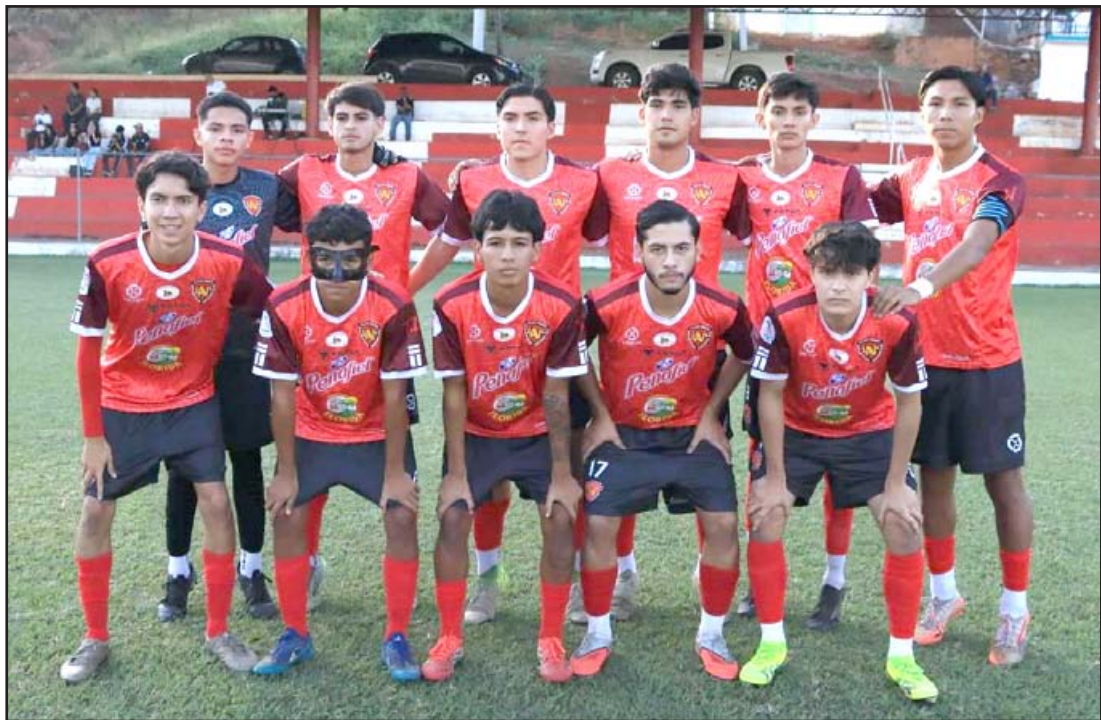
Atlético Nayarit va a enfrentar a VADS en Bahía de Banderas con la misión de sacar el triunfo

En la Unidad Deportiva de San José del Valle, Bahía de Banderas