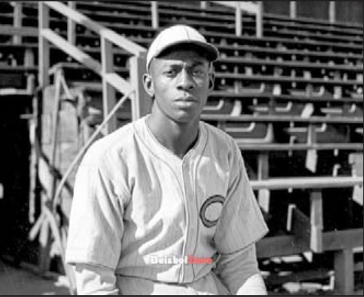
Satchel Paige no era un simple jugador... era un fenómeno que parecía salido de un mito, simple.. EL MEJOR PITCHER DE LA HISTORIA... Salón de la Fama