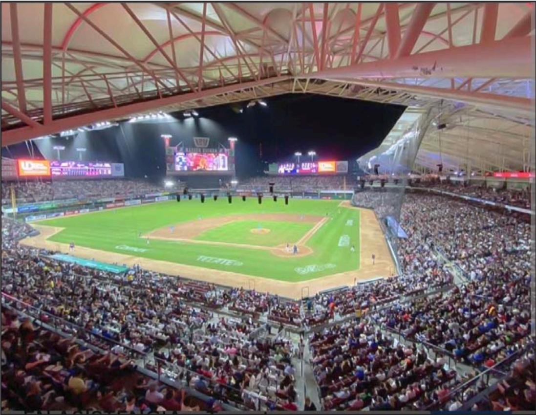
Imponente el parque de la Nación Guinda, Tomateros de Culiacán, con aforo para 20 mil fanáticos

sabe de beisbol pero hay una fuerte minoría que ni siquiera sabe como se juega el beisbol, pero “aiga sido como aiga sido”, van, ahí están presentes en la tribuna, disfrutando las botanas y las ambarinas, con atención calida, amable, profesional en los servicios que se le ofrecen a los aficionados, ya publicó Toño Arredondo Junior que los tacos de cochinita pibil están al cien y en mi caso, a pesar de que solo asistí a la inauguración, volveré al Coloso del Pacífico a degustar los platillos, claro con un par de cervezas bien helodias. Ojala y los flojonazos alcaldes de los municipios beisboleros, el que sea, correspondan al esfuerzo monumental que hacen los directivos de los Jaguares de Nayarit para ofrecer este excelso espectáculo del rey de los deportes, así como de la iniciativa del gobierno del doctor Miguel Ángel Navarro Quintero, se sumen, pero en serio, que se sumen, contratando autobuses que trasladen y retornen SIN COBRARLES ¡GRATIS! a los aficionados de las cabeceras municipales al “Coloso del Pacífico <Don Alejo Peralta>”, especialmente a los fanáticos de bajos recursos, que no tienen, como se dice coloquialmente “ni para pagar el camión”, que solo traen cuando menos cien pesos para el boleto de ingreso y si traen más, pues para pagar una cheve, aquí las autoridades nayaritas tienen que concatenar esfuerzos con las