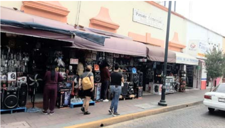
Pedro Lagunillas y Santa María del Oro.