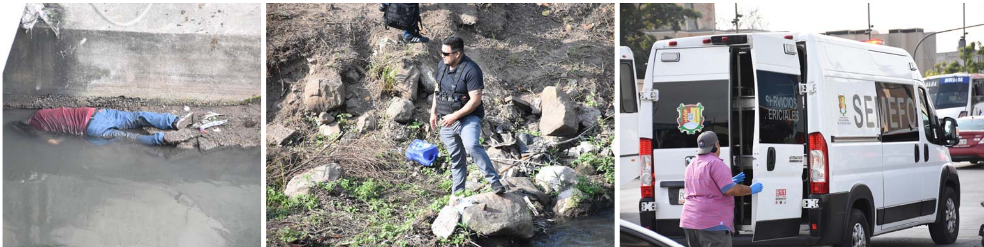
Bajo el puente del río Mololoa