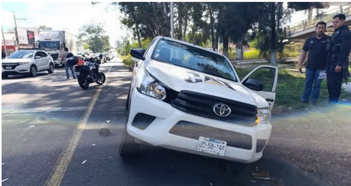
En el libramiento de Tepic