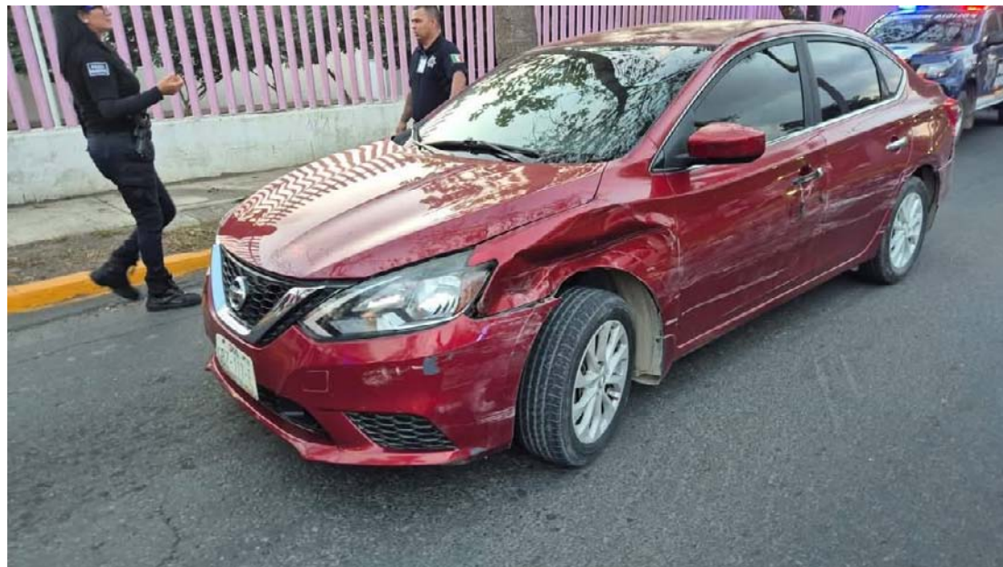
Recorrió medio Tepic