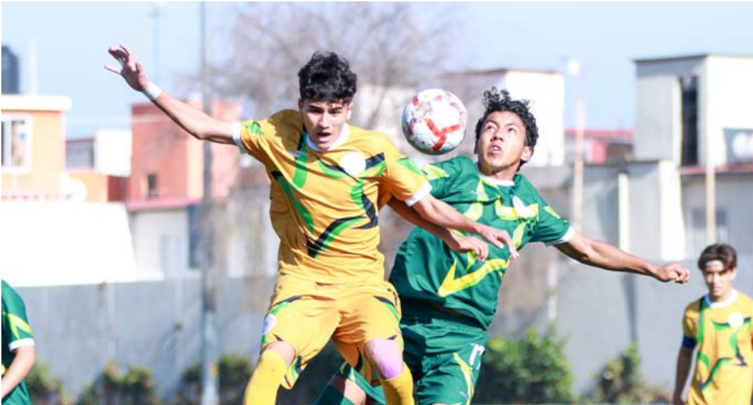
Ya están todos los clasificados y vienen los cuartos de final HOY JUEVES en el Torneo del Sol 2026 que empuja la TDP que preside el federativo nayarita, Pepe Escobedo Corro.