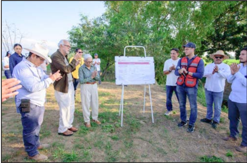
pública de asistencia social que enfoca sus esfuerzos en el bienestar de familias y comunidades vulnerables.