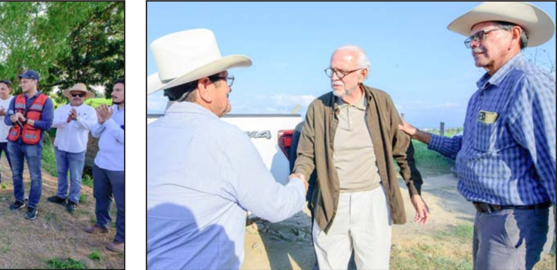
La construcción de esta nueva infraestructura en Zacualpan ha sido diseñada con las condiciones