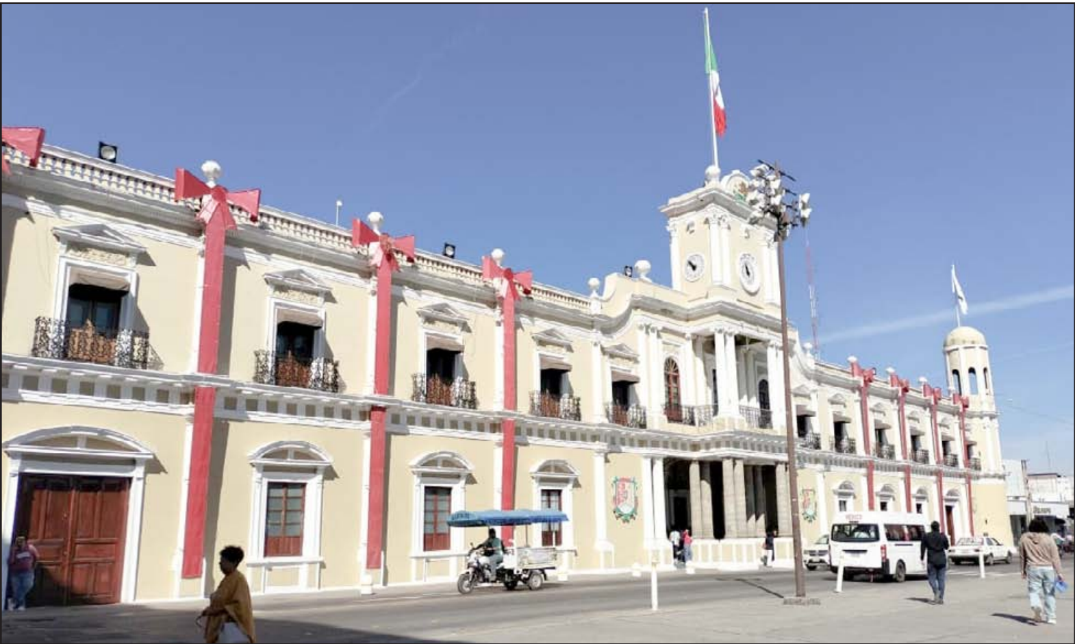
Con información de Oliva Orozco y Fernando Ulloa

El secretario de Finanzas confirmó el pago de la segunda parte del aguinaldo y bonos pendientes; la primera quincena de enero ya está garantizada con el nuevo presupuesto