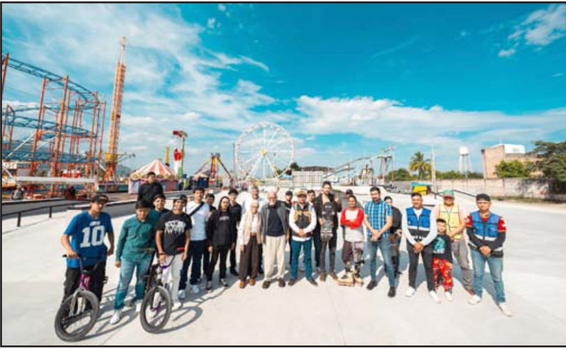
Recinto Ferial de Tepic.

Con esta visión, el gobernador del estado, Miguel