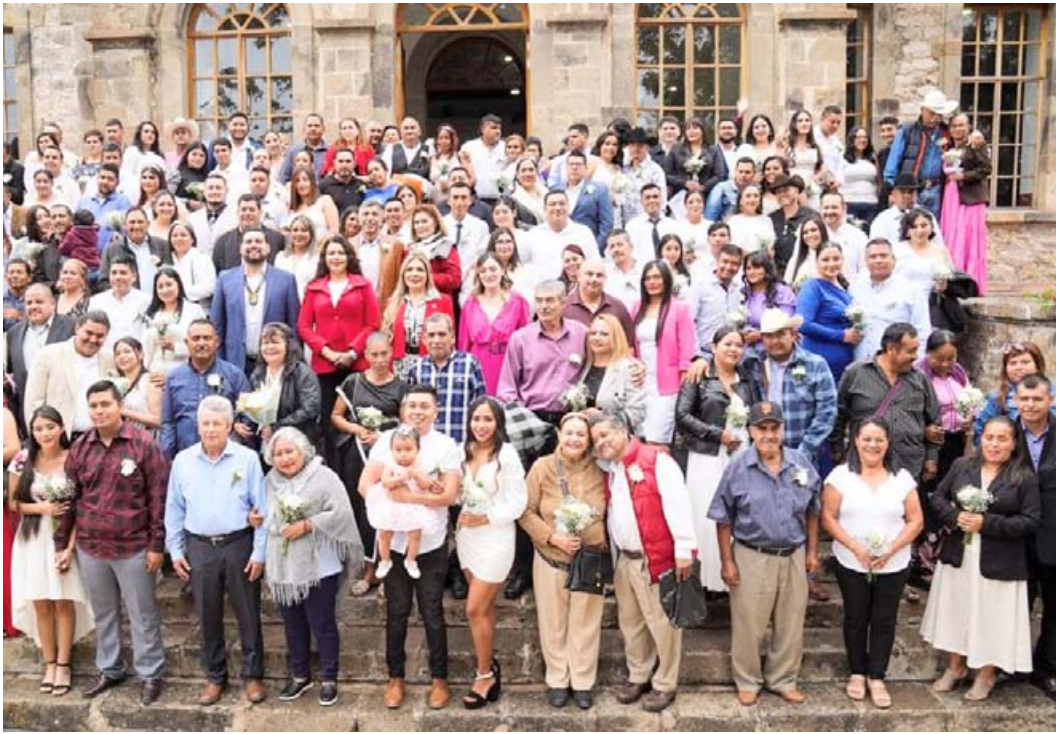
Registro Civil de Nayarit

Las autoridades sanitarias, federales y estatales, insisten en reforzar la vacunación, completar los esquemas pendientes y mantener una vigilancia epidemiológica activa, especialmente en estados como Nayarit, donde la transmisión se mantiene en niveles moderados pero constantes. La prevención sigue siendo la herramienta más efectiva para evitar que el brote escale y tenga consecuencias más graves en la población.