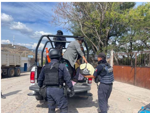
Rescatados por la SSPC