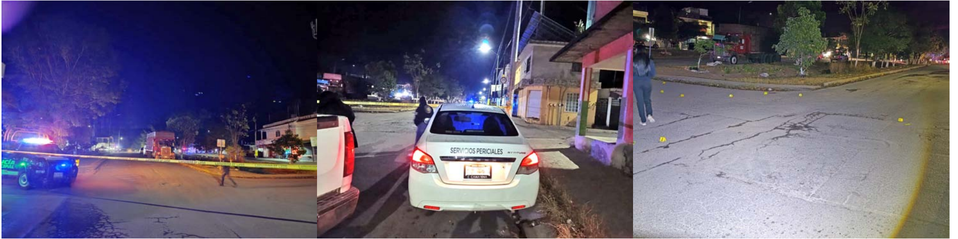
En Vistas de la Cantera