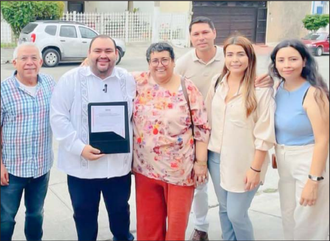
Pública de Nayarit.

Las acusaciones no son menores: Doble cobro y “aviadores”: Se ha señalado reiteradamente la existencia de nóminas infladas. Personajes que operan políticamente para el PT aparecen cobrando en la estructura de los Cendi sin pisar un aula, mientras otros “dobletean” sueldos entre la administración pública y el presupuesto escolar, defraudando directamente a la Hacienda