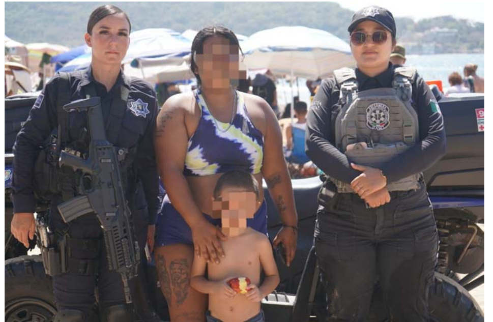
En playa Guayabitos