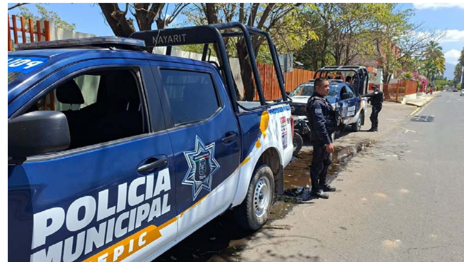
Detenidos frente al Tecnológico