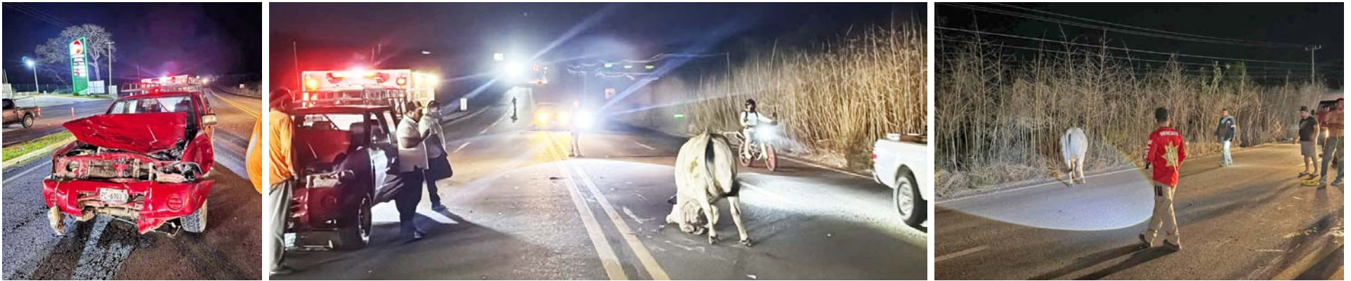
En la Tepic-Puerto Vallarta