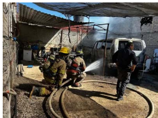
Ardió taller mecánico