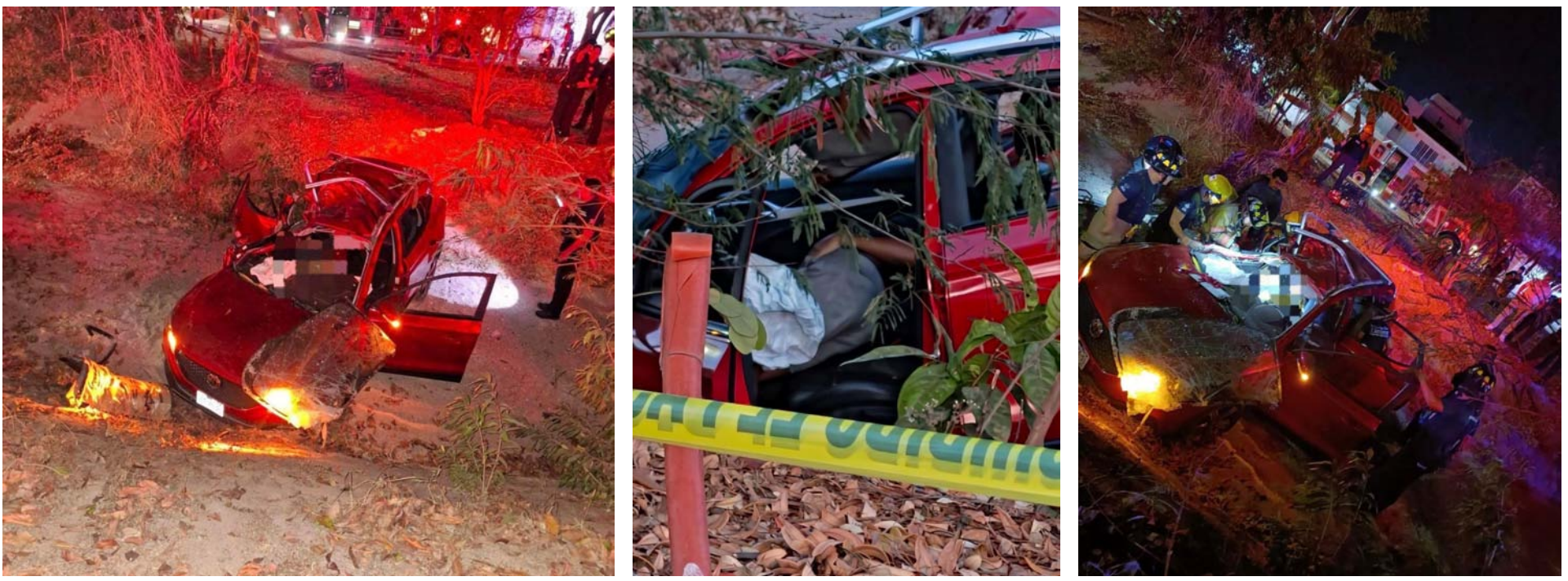
En la colonia Las Gaviotas