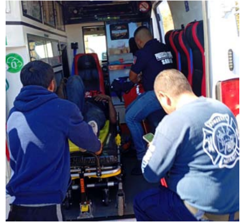
En la Tepic-Guadalajara