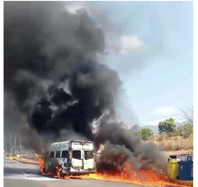
En la caseta de Trapichillo