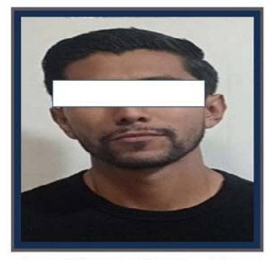
Se presume inocente, mientras no se declare su responsabilidad por la autoridad judicial. Art. 13, CNPP.