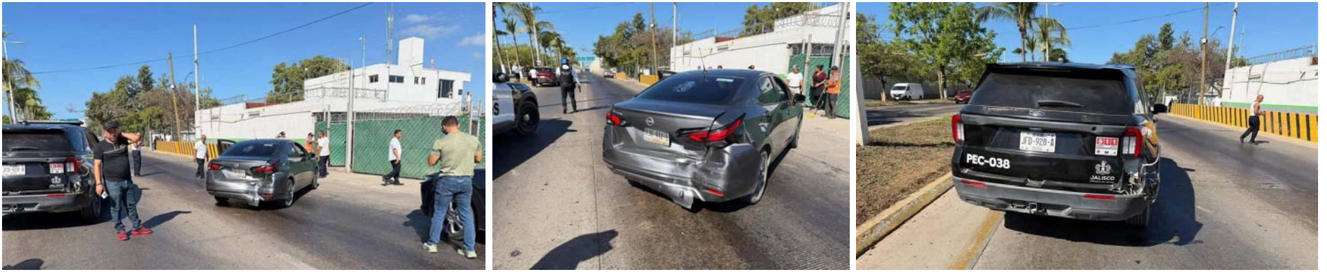
Ocho vehículos dañados