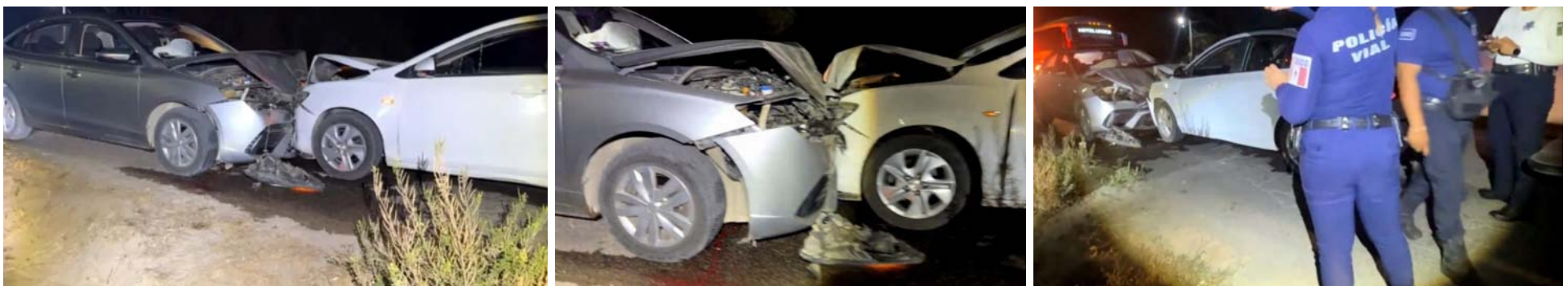
Carretera San José del Valle