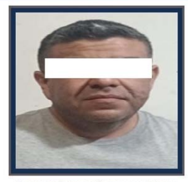
Se presume inocente, mientras no se declare su responsabilidad por la autoridad judicial. Art. 13, CNPP.