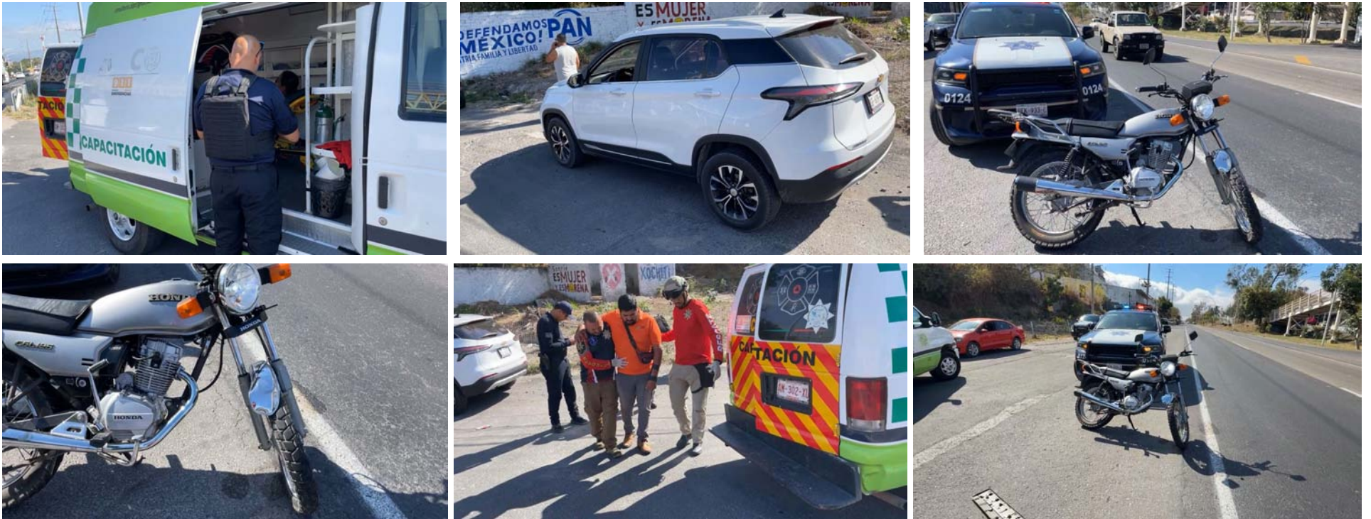
En el libramiento de Tepic