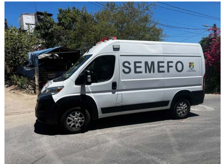
En la carretera a Xalisco