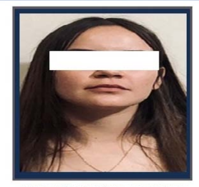
Se presume inocente, mientras no se declare su responsabilidad por la autoridad judicial. Art. 13, CNPP.