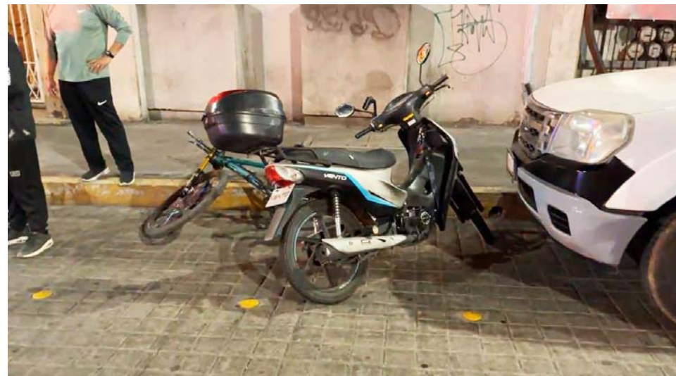
En pleno Centro Histórico de Tepic