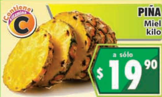
PIÑA Miel kilo