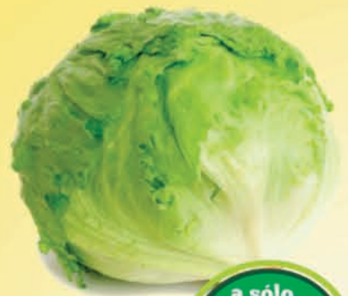
LECHUGA Romana pieza