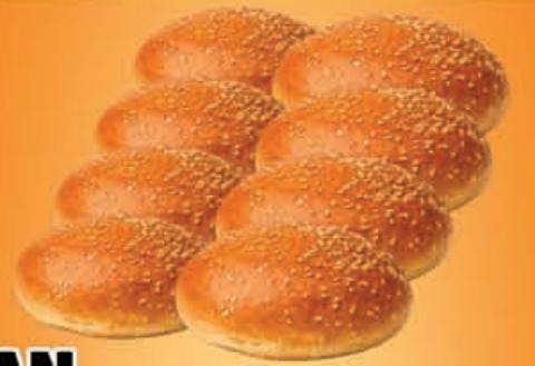
PAN PARA HAMBURGUESA bolsa de 8 pzas.