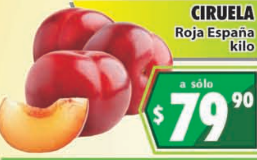
CIRUELA Roja España kilo