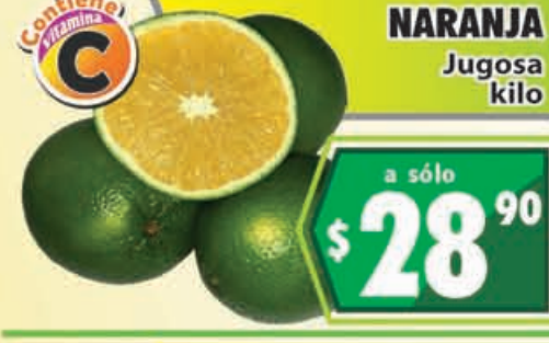
NARANJA Jugosa kilo