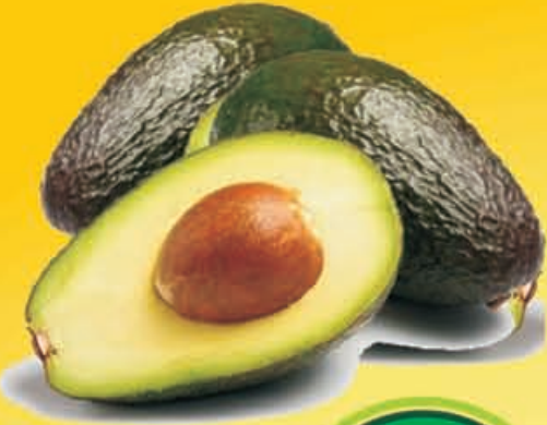
AGUACATE Hass kilo