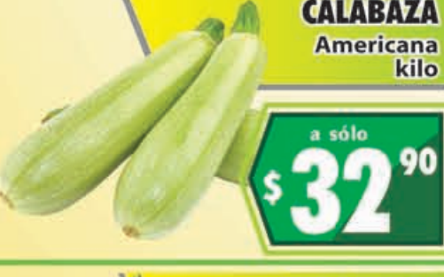
CALABAZA Americana kilo