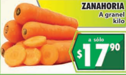
ZANAHORIA A granel kilo