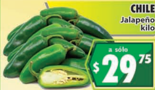
CHILE Jalapeño kilo