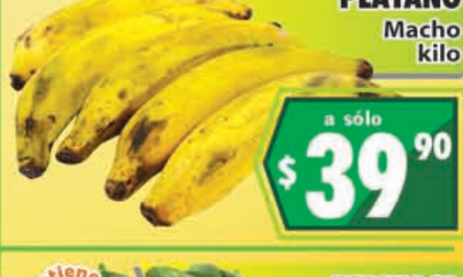
PLÁTANO Macho kilo