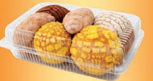
MINI PAN DULCE paquete 10 piezas