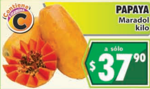
PAPAYA Maradol kilo