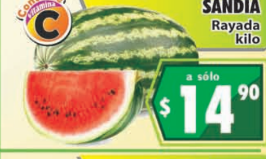
SANDÍA Rayada kilo