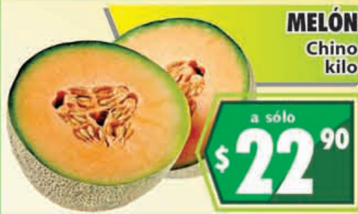
MELÓN Chino kilo