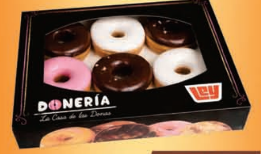
DONAS paquete 6 pz