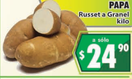
PAPA Russet a Granel kilo