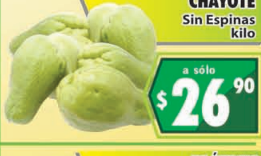
CHAYOTE Sin Espinas kilo