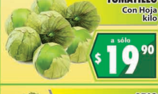
TOMATILLO Con Hoja kilo