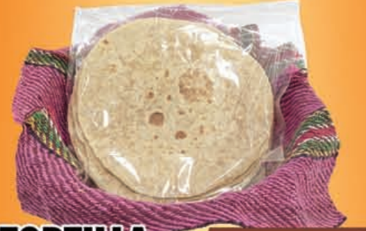
TORTILLA De Harina Paquete 10Pz