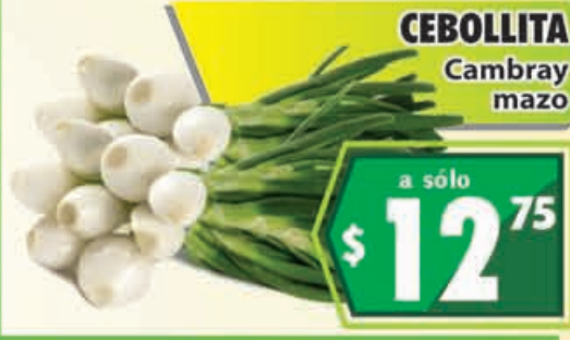
CEBOLLITA Cambray mazo