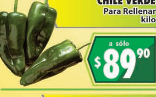
CHILE VERDE Para Rellenar kilo