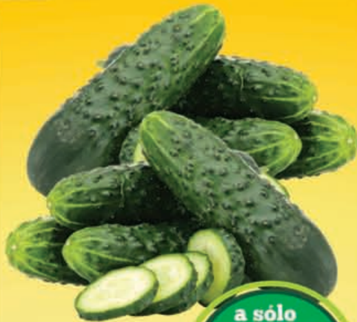
PEPINO Criollo Pickle kilo