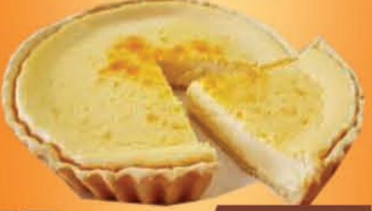
PAY De queso Premium