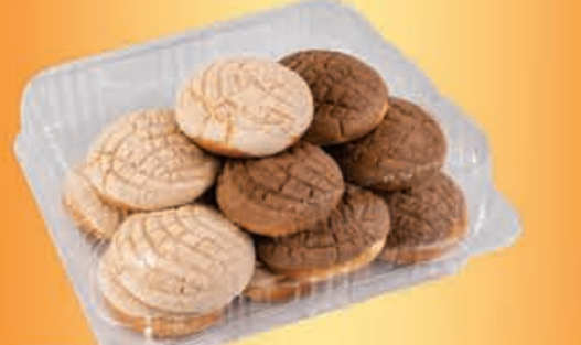
MINI CONCHAS paquete 10 piezas