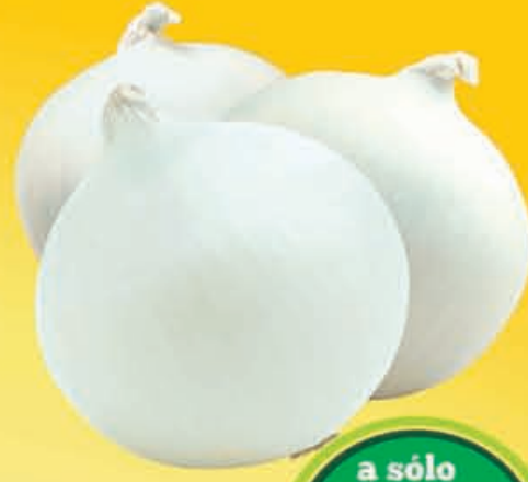
CEBOLLA Blanca kilo