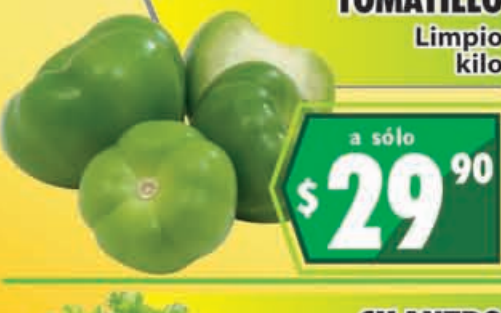
TOMATILLO Limpio kilo