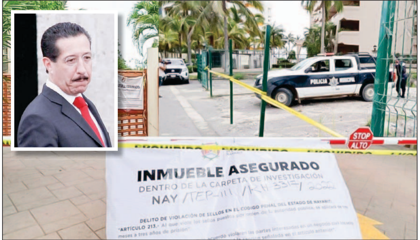
OSCAR VERDÍN CAMACHO/relatosnayarit

Revelan que Ney precisó al director del FIBBA que él decidiría a quién y a cómo se venderían los inmuebles administrados por el Fideicomiso