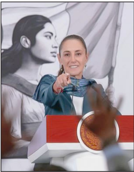
Registra México el abril con menos homicidios