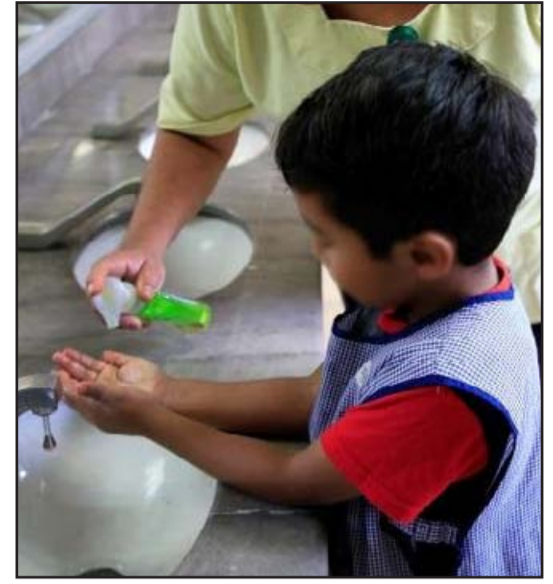
de orientación permanente para consolidar hábitos de bienestar colectivo.

Aquellas personas que presenten síntomas de deshidratación crítica o sangrado deben solicitar atención institucional de forma inmediata en las Unidades de Medicina Familiar. El monitoreo debe ser riguroso en menores de cinco años y habitantes de la tercera edad, sectores que presentan una vulnerabilidad mayor, mientras el organismo mantiene su esquema