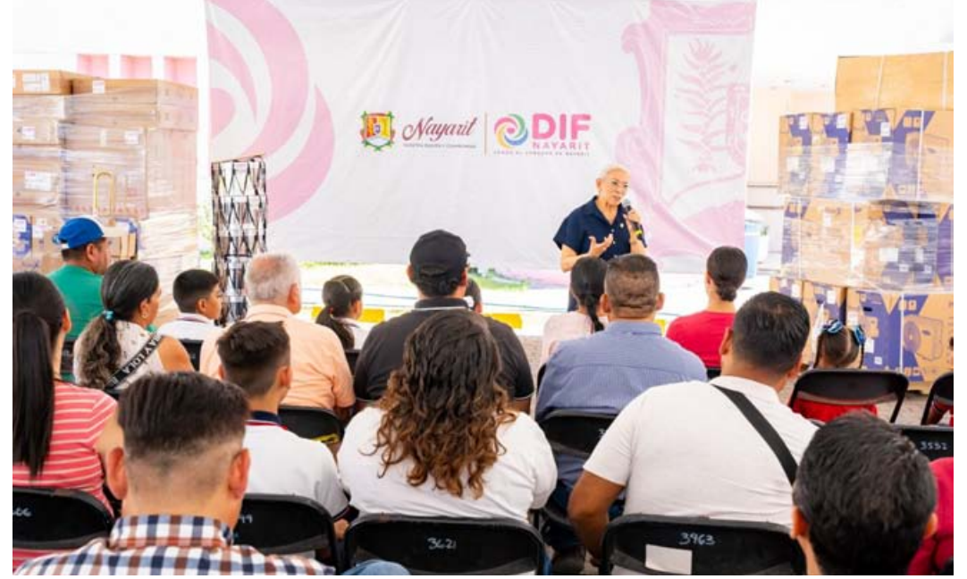
EN VARIOS MUNICIPIOS

Asimismo, se realizó la recreación del Camino de plata , un acto que simboliza el esfuerzo histórico de las familias de la entidad para cimentar la creación del centro de estudios superiores más importante de la geografía estatal. Aquellos estudiantes que resultaron ganadores del concurso Juventud al Mando por un Día acompañaron la jornada inaugural para conocer de cerca la toma de decisiones institucionales. El programa de actividades, que incluye presentaciones de libros y diversos talleres, se desarrollará durante tres días con el objetivo de continuar abriendo espacios culturales para los habitantes de la entidad.